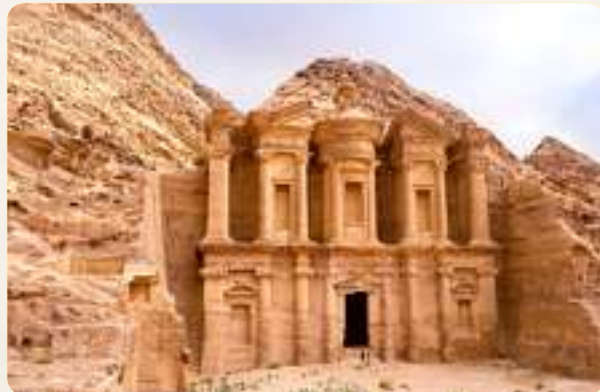
المنطقة التي انتظر فيها سيدنا موسى ١٠ سنوات ﷺ

وتابع مسيرة سبعة أو ثمانية أيام إلى أن وصل ماء مدين: ﴿وَلَمَّا وَرَدَ مَاءَ مَدْيَنَ وَجَدَ عَلَيْهِ أُمَّةً مِّنَ النَّاسِ يَسْقُونَ﴾.