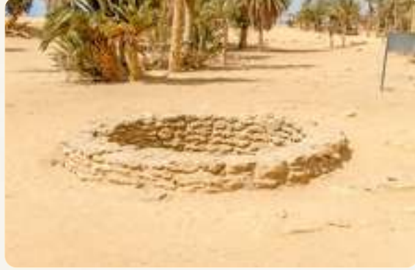
البئر التي سقى منها سيدنا موسى ﷺ

﴿وَلَمَّا تَوَجَّهَ تَلْقَاءَ مَدْيَنَ قَالَ عَسَىٰ رَبِّي أَن يَهْدِيَنِي سَوَاءَ السَّبِيلِ﴾ اتجه موسى عليه السلام وكأنه لا يعرف الطريق نحو مدين وهي قرية تقع في ساحل القسم الشرقي للبحر الأحمر، ولم تكن لفرعون سلطة عليها، وسار موسى وهو يجتنب الطريق لئلا يتعرض للمسافرين فيعرفه أحد، أو يقبض عليه أحد، ويدعو ربه أن يهديه الطريق فلا يضيع.