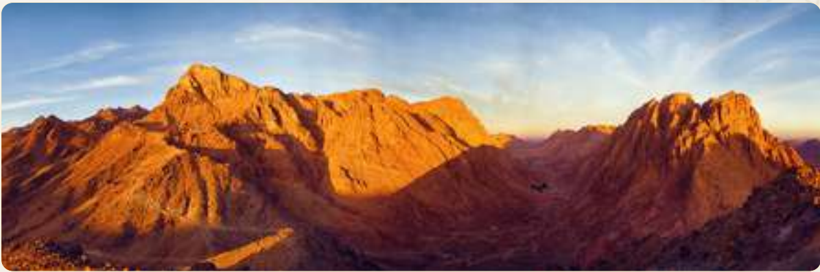
جبل موسى في سيناء